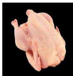
viande de poulet