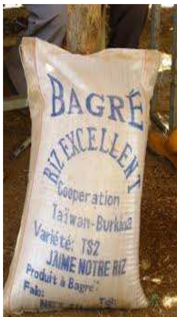
Riz de Bagré