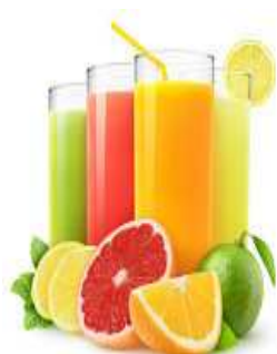
Jus de fruit