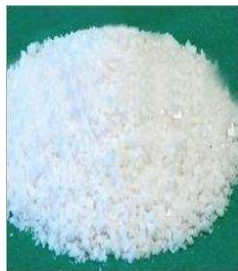
Sel de cuisine