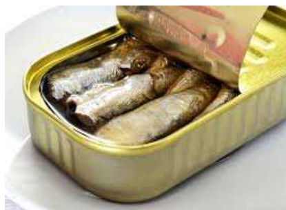
Conserve de poisson

Découvrez notre gamme de services et produits