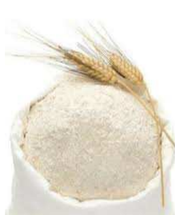
Farine de blé

Découvrez notre gamme de services et produits