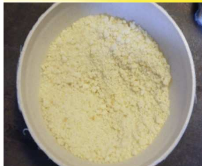
Couscous de manioc