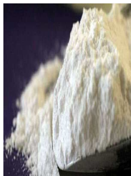
Lait en poudre