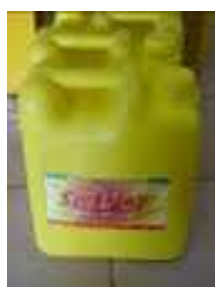
Huile de coton