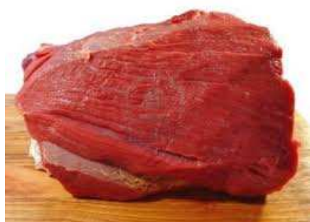
Viande de bœuf