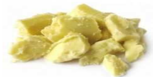
beurre de karité